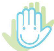
Capacidad para tomar conciencia de nuestras acciones sobre el medio ambiente