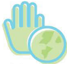
Conocimiento e interacción con el mundo físico