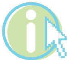
Tratamiento de la información y competencia digital