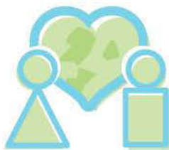
Conocimiento y comprensión de la problemática medioambiental