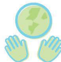
Capacidad de actuar para transformar el entorno