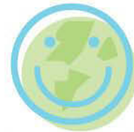
Social y ciudadana