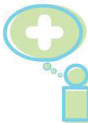
Aprender a aprender